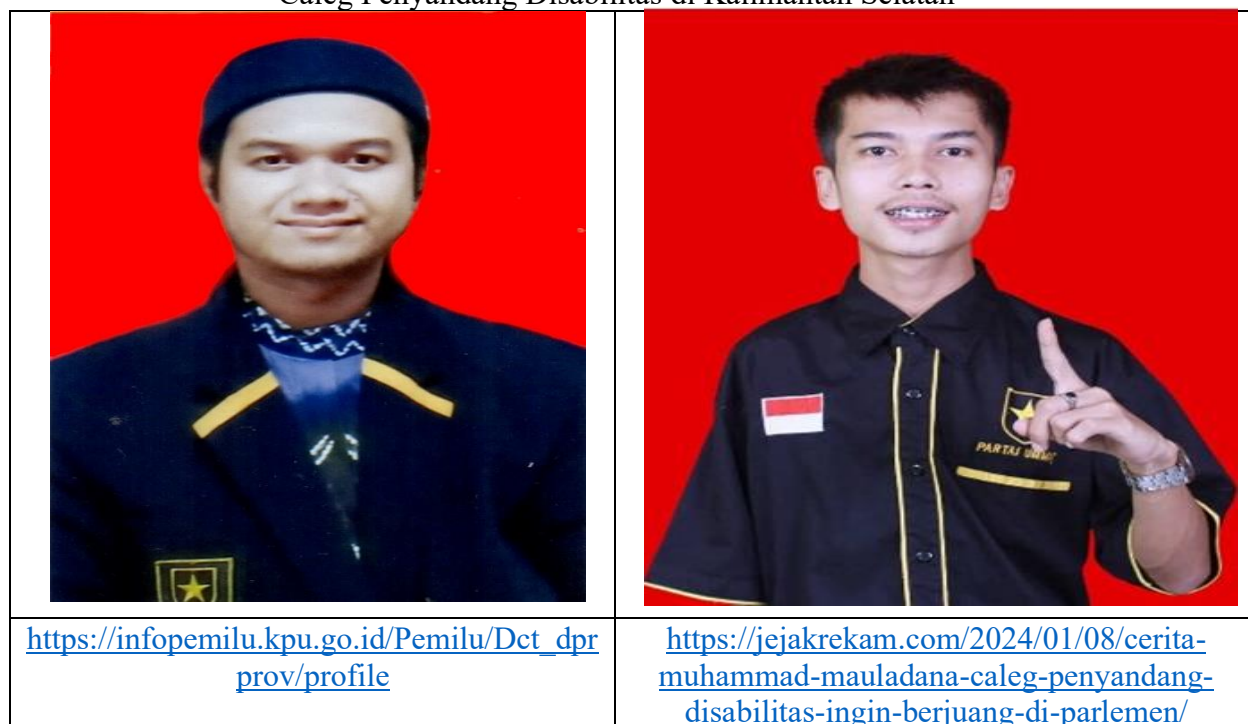
Gambar : Caleg Penyandang Disabilitas di Kalimantan Selatan

Dua orang penyandang disabilitas di atas sebagai calon legislatif DPRD Provinsi dan DPRD Kab/Kota, kedua kandidat ini berasal dari satu partai politik baru sebagai peserta