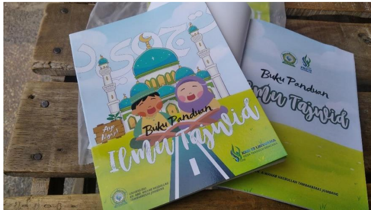
Gambar 7. Buku Luaran panduan ilmu tajwid