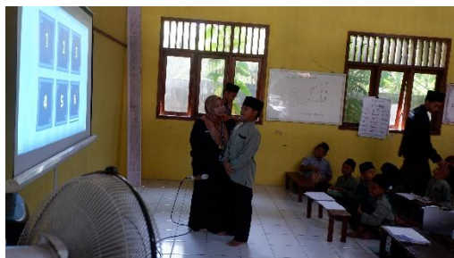
Gambar 5. ice breaking dengan permainan Edukatif word wall