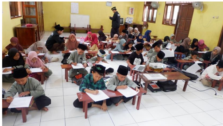
Gambar 6. Menjawab Soal (Evaluasi)