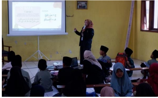
Gambar 4 foto saat narasumber menjelaskan