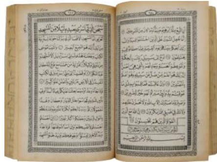
Mushaf Standar Usmani Pertama tahun 1983

Misalnya Saudi, tidak menuliskan harakat secara penuh; dimana mad thabi'i tidak diberi sukun, dan beberapa kalimat ada yang tidak diberi harakat. 14