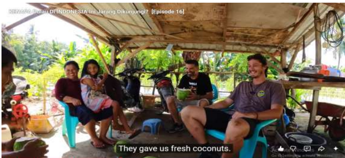
Gambar 2 Bahasa Indonesia dipakai untuk berkomunikasi Orang Asing dan Warga Lokal (Menit Ke 8)

Bahasa Indonesia, sebagaimana ditegaskan dalam Sumpah Pemuda 1928, merupakan simbol persatuan yang menyatukan masyarakat dari berbagai latar belakang etnis (Afif & Junadi, 2025; Syamsi et al., 2025). Dalam video The Lost Boys , bahasa Indonesia berfungsi sebagai medium komunikasi antara masyarakat lokal dengan wisatawan asing (Agustin et al., 2024). Meskipun terdapat keterbatasan dalam penguasaan bahasa asing oleh masyarakat Enggano, penggunaan bahasa Indonesia tetap menjadi sarana utama untuk menjembatani interaksi. Hal ini menegaskan peran bahasa Indonesia sebagai perekat identitas nasional sekaligus instrumen diplomasi budaya. Bahasa Indonesia tidak hanya menyatukan masyarakat dari berbagai latar belakang etnis, tetapi juga memperkuat citra bangsa di mata wisatawan asing. Dalam kegiatan pariwisata, bahasa Indonesia berfungsi ganda: sebagai simbol persatuan internal dan sebagai alat representasi eksternal (Kusumajanti et al., 2025).