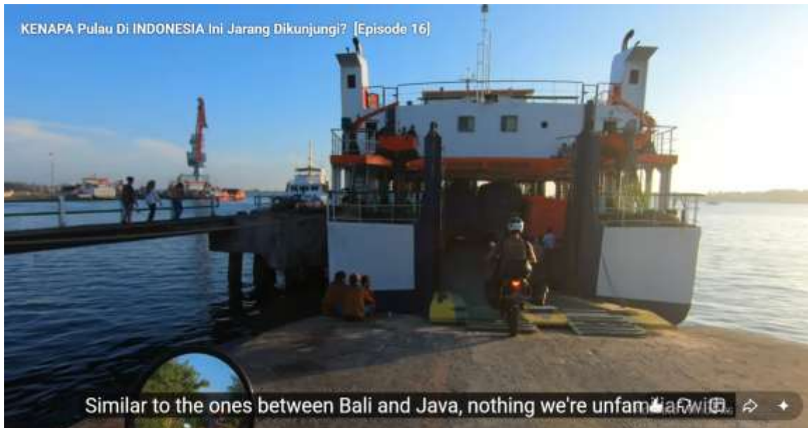
Gambar 3 Kapal Feri yang menghubungkan Pulau Enggano dengan dunia luar

Dalam perspektif nasionalisme, akses transportasi bukan sekadar sarana mobilitas, tetapi juga simbol keterhubungan wilayah terpencil dengan pusat nasional (J. T. Ibrahim et al., 2025). Peningkatan infrastruktur transportasi akan memperkuat integrasi Enggano ke dalam komunitas imajiner Indonesia, sekaligus membuka peluang bagi pengembangan pariwisata berkelanjutan dan diplomasi budaya yang lebih luas (Swabawa et al., 2025).