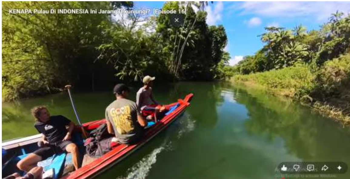
Gambar 5 Mengeksplorasi Keindahan Alam di Pulau Enggano