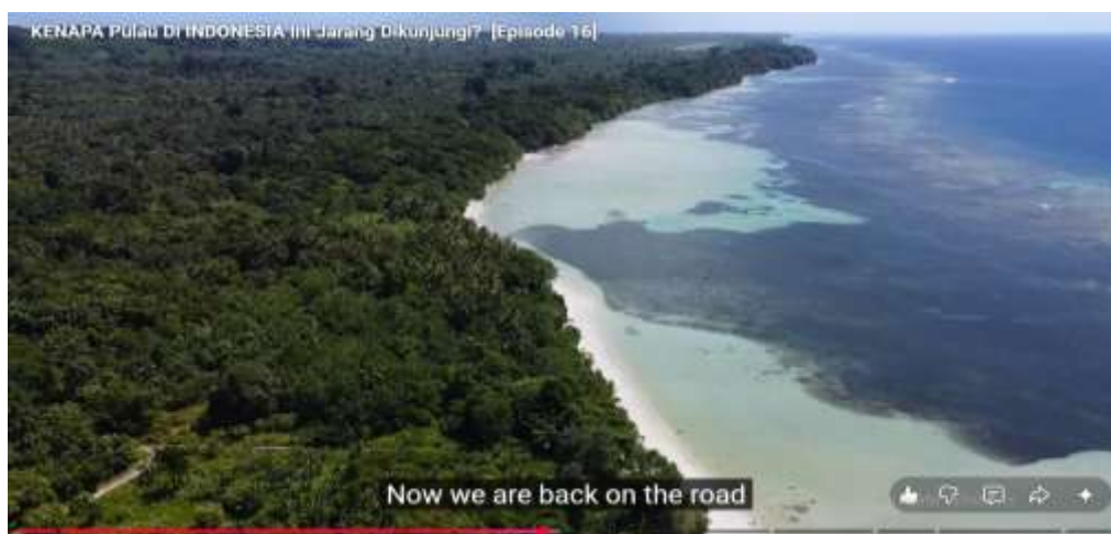
Gambar 1 Tampilan Salah Satu spot keindahan alam di Pulau Enggano yang didokumentasikan dalam Video Youtube (Menit Ke 11)

Bahasa Indonesia, sebagaimana ditegaskan dalam Sumpah Pemuda 1928, menjadi perekat identitas nasional (Qulub & Wibowo, 2026; Rinjani et al., 2026). Bahasa ini bukan sekadar alat komunikasi, tetapi juga simbol persatuan yang menyatukan masyarakat dari berbagai latar belakang etnis dan budaya. Dalam konteks pariwisata, bahasa Indonesia berperan sebagai medium yang memperkuat interaksi antara masyarakat lokal dengan wisatawan asing. Kehadiran orang luar di Enggano menegaskan pentingnya bahasa sebagai jembatan identitas. Jika masyarakat lokal mampu menggunakan bahasa Indonesia dengan bangga dan percaya diri, maka mereka tidak hanya memperkuat identitas nasional, tetapi juga menunjukkan keterbukaan terhadap dunia luar (Saputera, 2025). Bahasa menjadi sarana diplomasi budaya yang sederhana namun efektif.