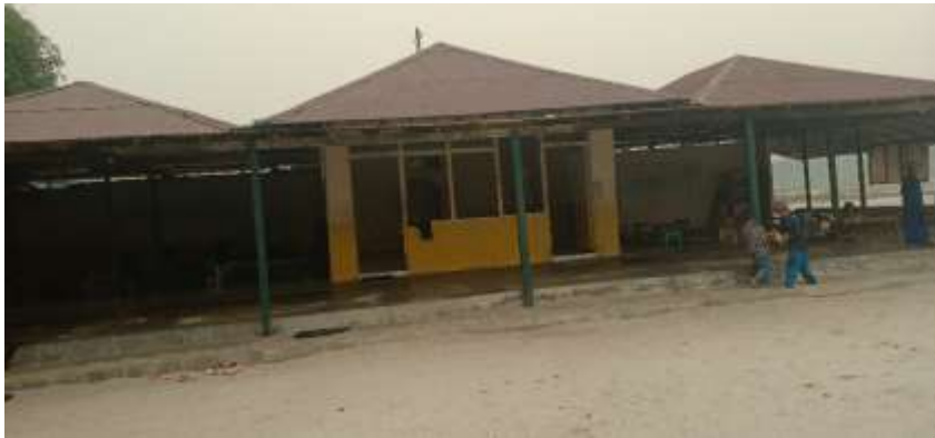
Gambar 1. Musholla dan ruang serba guna pesantren

Tempat pelaksanaan kegiatan belajar-mengajar bertempat di musholla dan aula serba guna disamping musholla, sebagaimana pada gambar berikut,