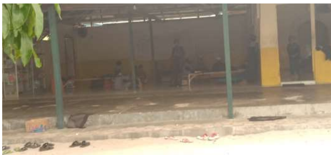
Gambar 2. Pelaksanaan Tahfiz al-Qur'an Salafiyah IQRO