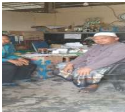
Gambar 3. Dokumentasi pengawas hafalan santri Pesantren Tahfiz Al-Qur'an

Santri yang telah mencapai target program tahfiz secara penuh, maka diadakan kegiatan ujian hafalan sebanyak 3 juz dalam dua kali setahun dan pengendalian ini secara langsung oleh pimpinan pondok pesantren salafiyah IQRO.