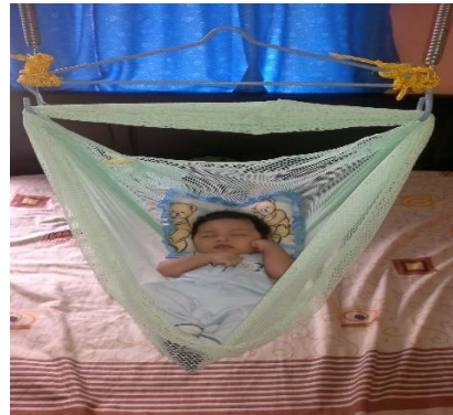
Gambar. Tradisi tidur dalam ayunan

keyakinan dalam rukun iman. Ritual seperti membaca zikir, senandung al-qur'an, sholat nabi, dan berdoa. Hal ini berlangsung hingga anak terlelap yang dilakukan setiap hari selama masa pengasuhan.