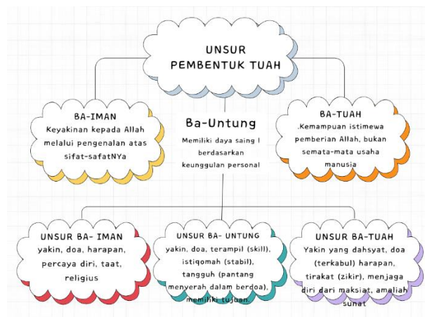
Tabel. Unsur pembentuk tuah

Penerapan konsep “Pyramida BA” dalam pelaksanaan pendidikan keluarga, menitikberatkan pada “tuah” orangtua atas seluruh keberhasilan dan keberuntungan anak-anaknya. Tuah berasal dari harapan yang tidak tetap dan tidak berpindah. Penelitian Weil (2000) menyebut bahwa diantara faktor yang membentuk harapan adalah keyakinan religius. Suryadi dan Hayat mengutip Shihab (2021) mengatakan bahwa indikator religius antara lain adalah: Mengenal Allah melalui sifat-sifatnya Yang Maha Tinggi dan Terpuji, memiliki keyakinan secara mendalam (taat), dan melaksanakan amaliah sunat seperti berdoa dan membaca Al-Qur’an.