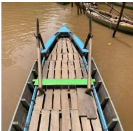
Gambar 1. Bentuk Sampan Leper Tembilahan Indragiri Hilir

Eksistensi menurut Save M. Dagun adalah keadaan manusia yang terus berkembang melalui aktivitas dan usaha mempertahankan dirinya. Tradisi Pacu Sampan Leper di Tembilahan bermula pada tahun 1990-an sebagai alat transportasi masyarakat saat air surut. Tradisi ini mulai diperlombakan pada tahun 1995 dan terus bertahan hingga kini. Sampan Leper menjadi simbol budaya yang memiliki nilai historis dan fungsional dalam kehidupan masyarakat pesisir. Pemerintah Kabupaten Indragiri Hilir menjadikan tradisi ini sebagai ajang tahunan berskala provinsi. Hasil wawancara dengan tetua Misri menegaskan pentingnya sampan Leper sebagai bagian dari identitas dan kebanggaan masyarakat lokal.