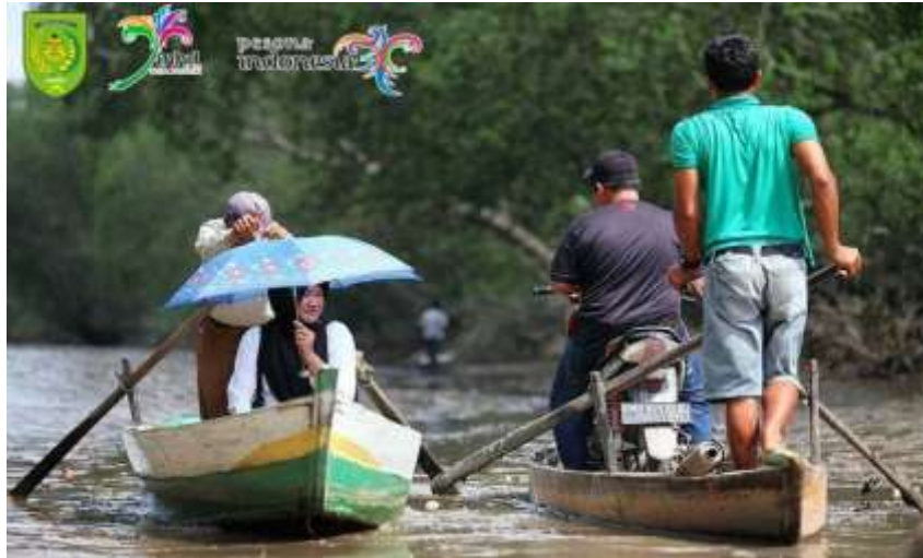
Gambar 2. Aktivitas Kerja Pacu Sampan Leper Sebagai Transportasi

muatan lokal di sekolah, promosi media sosial, hingga keterlibatan aktif Lembaga Adat Melayu dan pemerintah daerah. Diharapkan, dengan kolaborasi semua pihak, festival Pacu Sampan Leper dapat kembali digelar dan menjadi ikon wisata budaya unggulan Indragiri Hilir. Tradisi ini bukan hanya hiburan semata, tetapi juga bentuk konkret keberlanjutan budaya yang patut dijaga oleh generasi masa kini dan mendatang (Syafi'i, 2023).