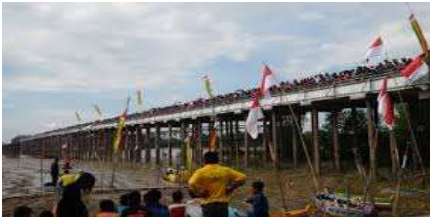
Gambar 3. Festival Pacu Sampan Leper di Kabupaten Indragiri Hilir

Aktivitas kerja dalam festival ini dilakukan oleh panitia dan peserta. Panitia bertugas mengadakan rapat, mengatur teknis lomba, menyusun struktur acara, dan menyiapkan perlengkapan serta promosi. Sementara itu, peserta menghias sampan, memeriksa kondisi sampan, dan melakukan ritual untuk memperkuat mental. Ritual berupa jampi-jampi dilakukan oleh sebagian peserta dengan tujuan memenangkan perlombaan. Hadiah yang ditawarkan juga menjadi daya tarik tersendiri bagi peserta. Tradisi ini turut melibatkan hiburan seperti tari persembahan, rebana, dan silat Melayu dalam upacara pembukaan.