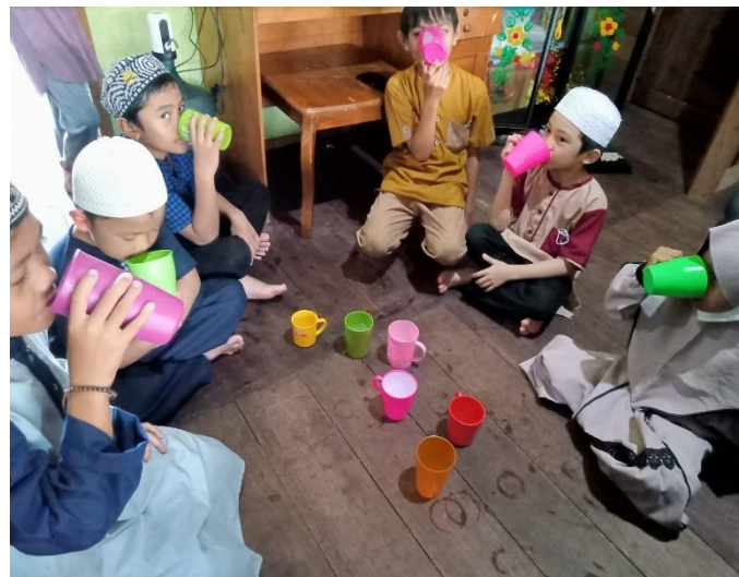
Foto 2: Peserta didik sedang meminum susu kambing sebelum belajar

Hal inilah (makan kurma dan minum susu kambing serta menghafal di luar kelas) yang membedakan Rutaba Hijrah sulingan dengan rumah tahfidz yang lainnya yang ada di Kabupaten Tabalong.