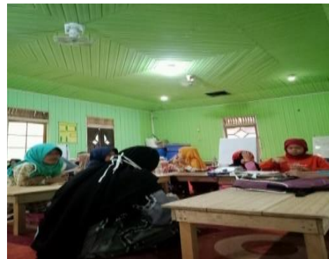
Gambar 4.3 kelas tilawati