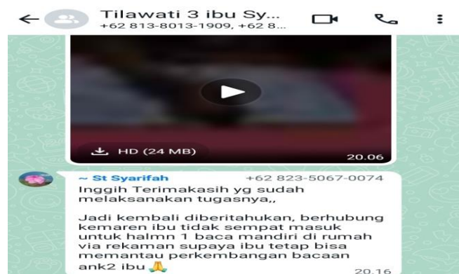
Gambar 4.9 Grup whatsapp tilawati 3

Berdasarkan wawancara di atas, diketahui bahwa dalam belajar tidak selalu menghasilkan nilai yang bagus pasti ada sewaktu-waktu nilai yang didapatkan tidak sesuai dengan target yakni kelancaran bacaan santri. Santri akan bisa lanjut ke halaman berikutnya dengan syarat dalam bacaan santri yang lancar lebih dari 70% akan dilanjutkan kehalaman berikutnya, sedangkan bacaan santri yang kurang dari 70% maka halaman tidak dilanjutkan. Bagi santri belum mencapai target tersebut, maka solusi yang dilakukan ustadzah memberikan bimbingan lewat whatsapp . Ustadzah akan mengirimkan voice note berupa pelajaran hari ini dan dipinta kepada para santri akan membacanya di rumah, jika sudah membaca maka wali santri akan mencatat nama santri yang sudah membacanya. Gambar di bawah ini memperlihatkan hubungan ustadz dengan wali santri lewat grup whatsapp .