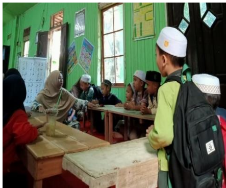
Gambar 4.2 Tempat duduk

Ustadz dan ustadzah berada di depan tengah santri dan di samping alat peraga. Jika alat peraga digunakan maka duduk ustadzah akan geser kesamping sehingga para santri dapat membaca alat peraga. Tujuan dari aturan ini yakni untuk menjaga suasana kelas yang nyaman dan ustad/ustadzah juga dapat secara langsung memperhatikan setiap santri selama proses belajar. Gambar di bawah ini memperlihatkan tempat duduk di kelas tilawati setiap proses belajar berlangsung.