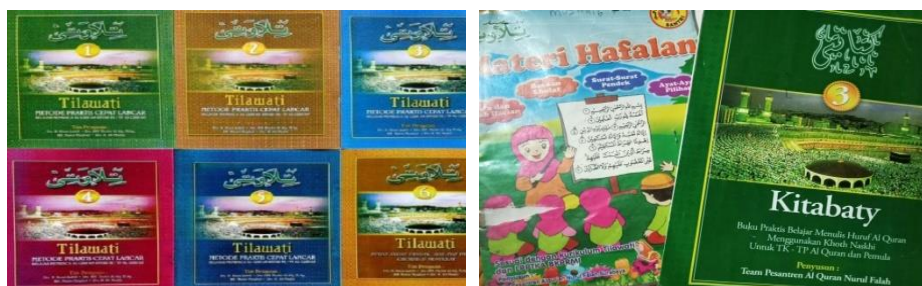
Gambar 4.6 Materi baca al-Quran dengan metode tilawati

Penggunaan metode tilawati ini memiliki buku-buku yang dibutuhkan yakni adanya buku materi pokok yang dimiliki semua santri buku ini berupa bacaan huruf-huruf hijaiyah , buku hafalan jua yang dimiliki semua santri di dalam buku ini sudah terdapat surah-surah yang perlu dihafal santri jika santri sudah hafal maka akan diberi tanda bahwa surah tersebut sudah dihafalkan dan buku kitabaty yang dimiliki semua santri buku ini untuk melatih tulisan santri.