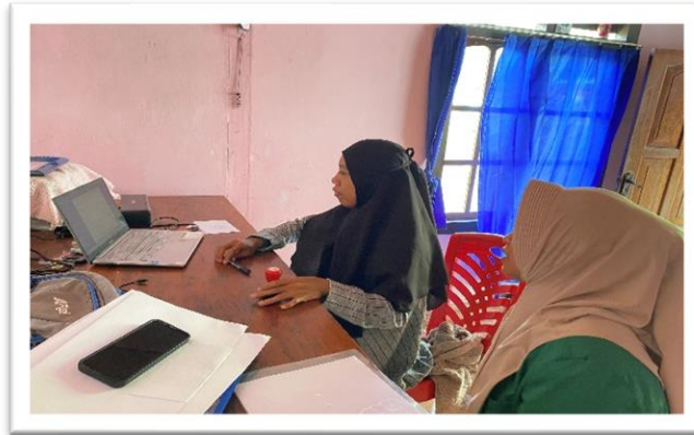
Gambar 2. Koordinasi kegiatan pendampingan Pelaksanaan Pendampingan Pembuatan Blogspot

Kegiatan ini dilaksanakan pada tanggal 24 Juli 2024 sampai dengan 25 Juli 2024, yaitu melakukan koordinasi kepada Sekretaris Desa perihal waktu dan tempat pelaksanaan pendampingan yang akan di laksanakan di Desa Ondoliang.