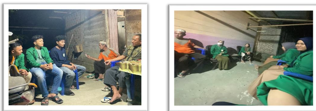
Gambar 1. Kegiatan Observasi di Desa Ondoliang Kecamatan Balantak Utara Kabupaten Banggai

Kegiatan ini dilaksanakan pada tanggal 23 Juli 2024, bertempat di rumah bapak Kepala Desa Ondoliang Kecamatan Balantak Utara Kabupaten Banggai. Kegiatan ini dilakukan melalui wawancara langsung dengan kepala desa, aparat desa dan mahasiswa KKN Ondoliang.