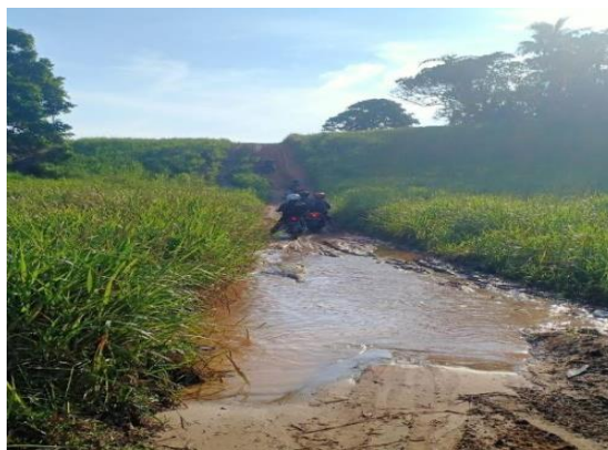
Gambar 3 : Akses Jalan Menuju Pantai Senggiling

hanya dapat di lalui dengan kendaraan roda 2 karena akses menuju ke lokasi yang sulit untuk di lalui kendaraan roda 4.