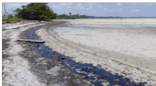
Gambar 4 : Sludge Oi

Sludge oil yang terapung dilaut hingga akhirnya terdampar di pesisir Pulau Bintan ini telah merusak ekosistem laut dan merusak pantai yang berada di kawasan pariwisata. Ekosistem laut yang mengalami dampak dari keberadaan sludge oil antara lain padanlamun, terumbu karang, dugong, pesut, hiu paus, kuda laut, teripang, ikan napoleon, kima, lola, terancam punah (Dhena et.al, 2019) Minyak hitam juga telah mencemari dan mengotori tanaman bakau, bebatuan alam, pasir putih, kelong apung serta fasilitas wisata air yang menjadi daya tarik wisata dan tujuan wisata.