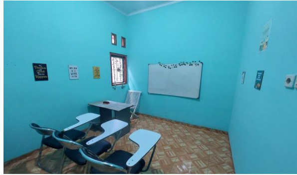
Gambar 1. Kondisi Ruang Kelas 1