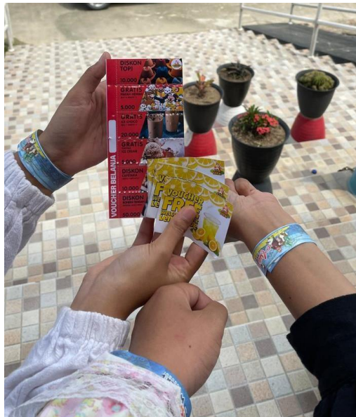
Gambar 22. Tiket Masuk

Tidak hanya free drink, pengunjung juga akan mendapatkan voucher gratis ataupun diskon selama di berada Asia Farm. Ada banyak diskon di dalam voucher.