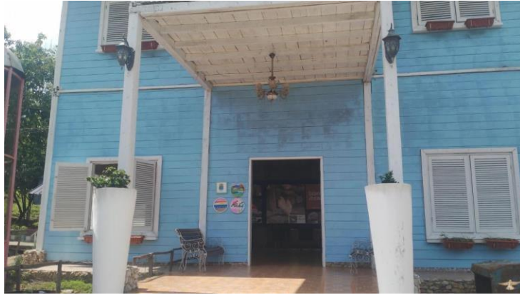
Gambar 19. Rumah Lukis