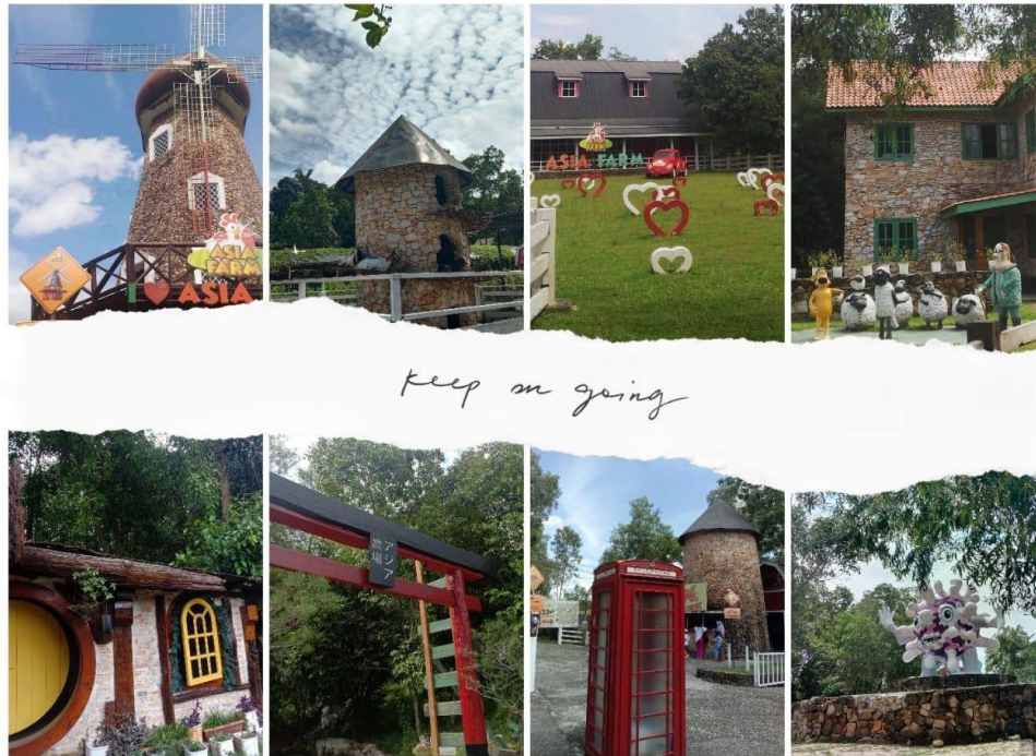
Gambar 5. Spot Foto Aesthetic