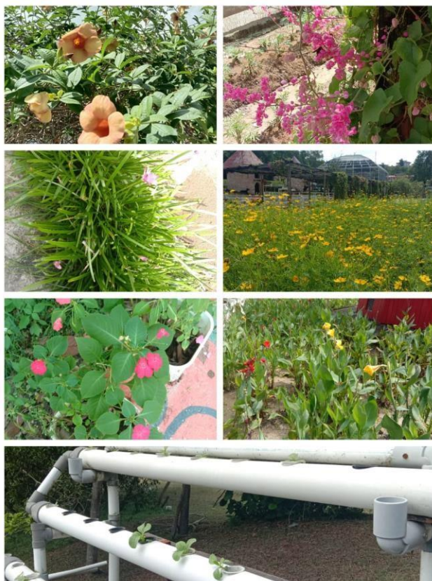
Gambar 4. Berbagai Jenis Tanaman

Daya tarik utama yang identik dengan farm ya tanaman. Nah, di Asia farm pengunjung bisa juga melihat berbagai jenis tanaman, baik itu macam-macam bunga, buah maupun sayuran. Ada tanaman hidroponik juga loh! Bunga ini bisa dijadikan sebagai spot foto yang menampilkan suasana alam aesthetic dan juga edukasi mengenai jenis tanaman dan cara merawatnya.