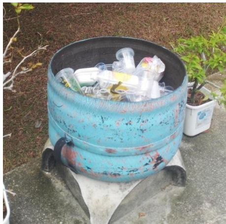
Gambar 13. Tempat Sampah

Nah, sebagai masyarakat bumi kita harus menyayangi bumi. Jangan khawatir, di Asia farm terdapat tempat sampah yang juga tersebar di setiap sisinya. Jadi, pengunjung gaperlu lagi ngantongin sampah di dalam saku atau tas, langsung buang aja. Dan pastinya ini membantu kita untuk tetap menjaga lingkungan sekitar agar tetap bersih dan bebas dari penyakit ya!