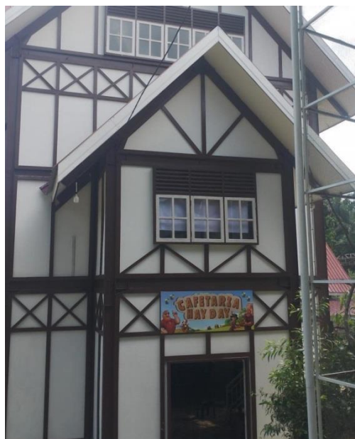
Gambar 15. Cafeteria

Ketika kita memasuki Asia Farm kita akan menjumpai sebuah cafeteria yang menawarkan kuliner unik dengan konsep yang mengangkat tema alam dan pertanian. Cafeteria Hayday merupakan bagian dari fasilitas pendukung dengan menyajikan berbagai menu yang terbuat dari produk pertanian lokal. Pengunjung dapat menikmati makanan segar