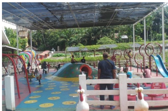
Gambar 11. Tempat Bermain

Bagi pengunjung yang anaknya merasa bosan bisa mengajaknya ke tempat bermain, tentunya terdapat banyak wahana yang seru dan menyenangkan. Hal ini juga bermanfaat karena anak bergerak dan berkeringat. Di dalam tempat bermain terdapat berbagai jenis wahana seperti pada gambar.