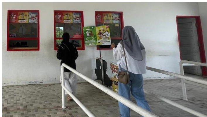
Gambar 20. Tempat Pembelian Tiket

Pengunjung akan di minta membeli tiket masuk ke Asia farm dan memilih paket sesuai yang disediakan. Setelah itu pengunjung akan diberi gelang tangan dan bisa mulai petualangan di Asia Farm.