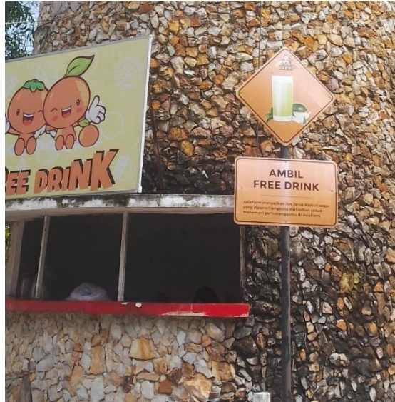
Gambar 21. Free Drink