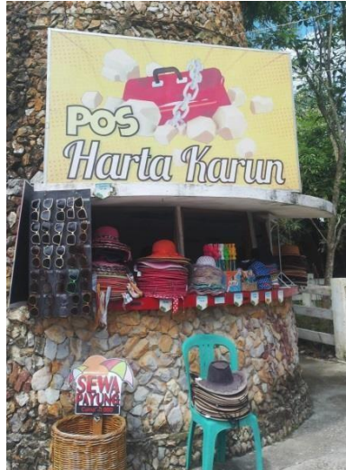
Gambar 17. Pos Harta Karun