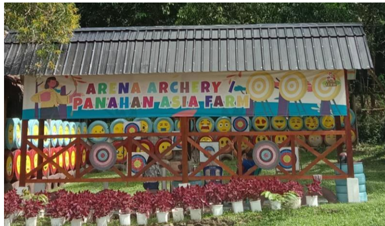
Gambar 18. Tempat Panahan

Selain melihat hewan dan tumbuhan, pengunjung juga bisa menyewa panahan untuk menikmati waktu selama liburan.