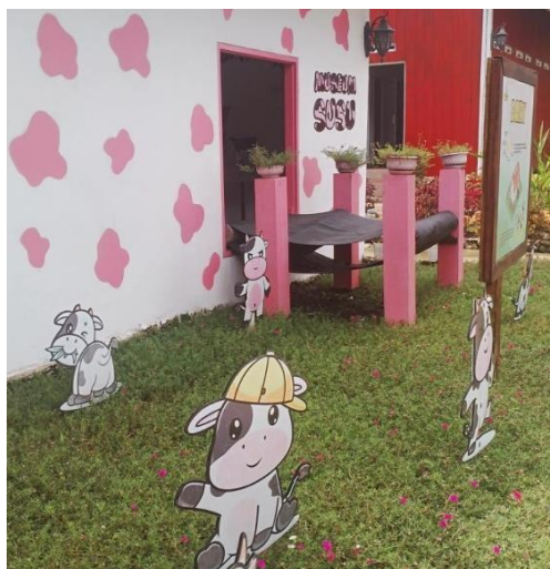
Gambar 7. Museum Susu