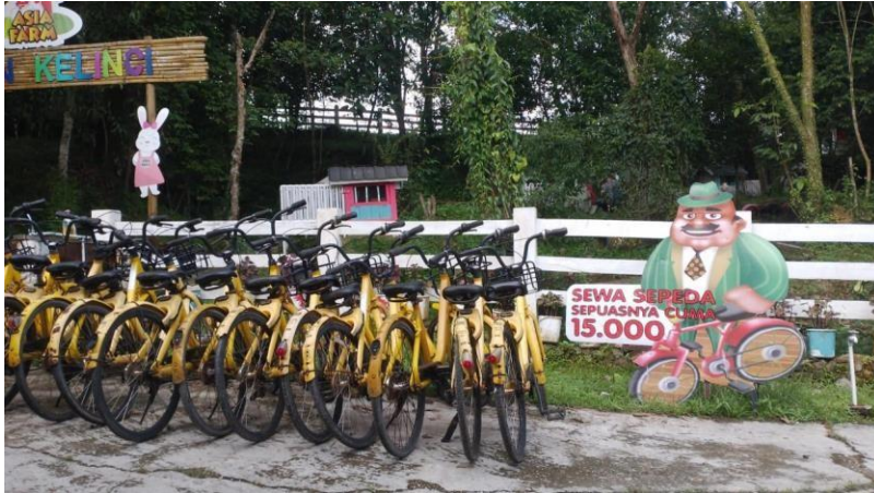
Gambar 23. Sewa Sepeda