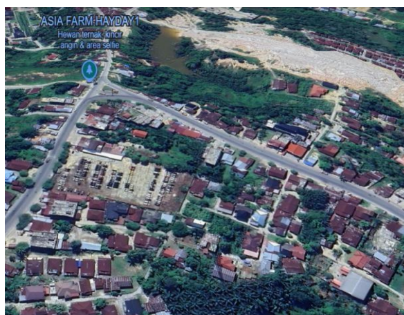
Gambar 8. Jalan menuju Asia Farm

Kondisi jalan menuju Asia Farm Pekanbaru dari pusat kota cukup baik dan nyaman dilalui. Jalan utama yang mengarah ke Asia Farm umumnya terawat dengan baik, dengan permukaan yang mulus dan bebas dari hambatan besar. Pengunjung yang menggunakan kendaraan pribadi atau transportasi umum tidak akan kesulitan mencapai lokasi. Meskipun demikian, selama jam sibuk, mungkin ada sedikit kemacetan di beberapa titik, namun secara keseluruhan, akses menuju Asia Farm cukup mudah dijangkau. Jaraknya mungkin membutuhkan waktu sekitar 30-40 menit berkendara dari pusat kota Pekanbaru, tergantung kondisi lalu lintas. Jalan menuju Asia Farm relatif baik dan nyaman, sehingga pengunjung