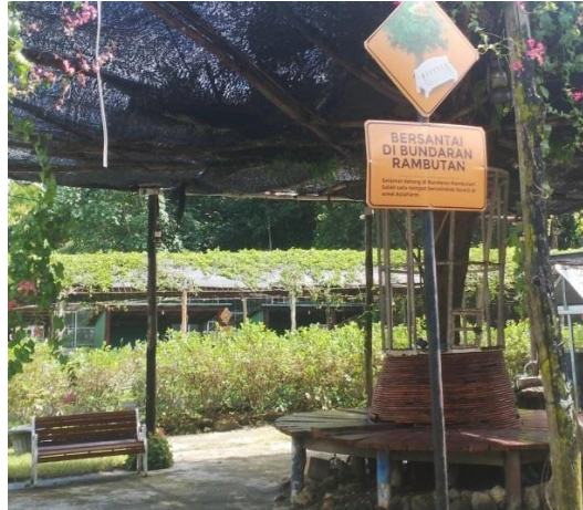
Gambar 12. Tempat Bersantai