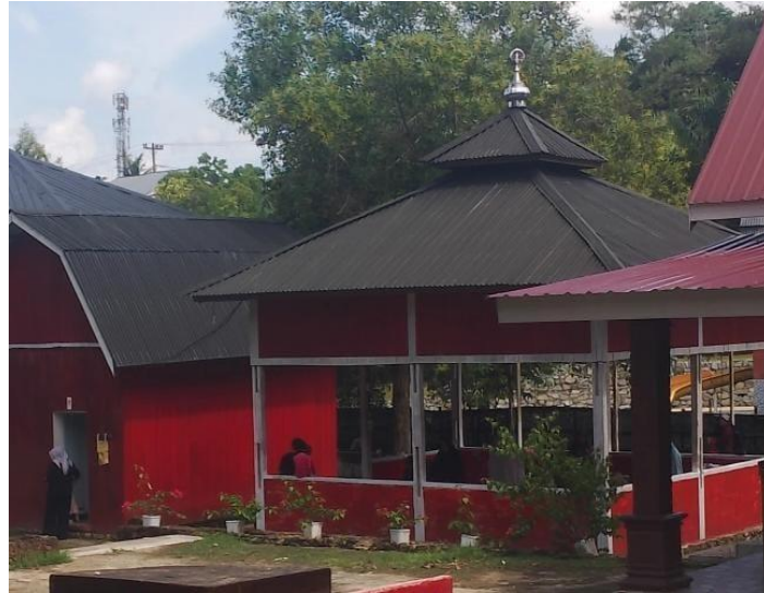
Gambar 10. Mushola