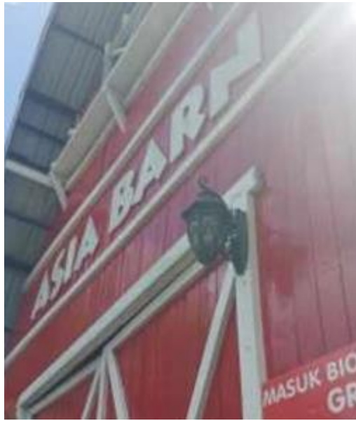
Gambar 6. Asia Barn