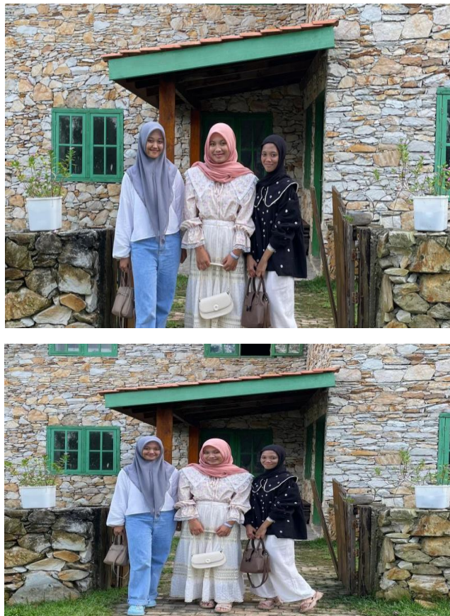
Gambar 25. Tim Peneliti