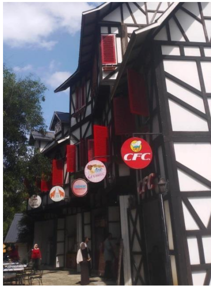
Gambar 16. Mini Café

Selanjutnya, terdapat mini cafe outdoor yang menawarkan pilihan kuliner sederhana namun menggugah selera. Di sini, pengunjung dapat menikmati berbagai jenis makanan dan minuman seperti ayam goreng, ice cream, corn dog, sert fruit juice dan berbagai macam rasa minuman ice blended. Meskipun menu yang disajikan terbatas, suasana santai dan pemandangan alam yang indah membuat mini cafe menjadi tempat yang menyenangkan untuk menikmati camilan dan bersantai bersama teman atau keluarga.