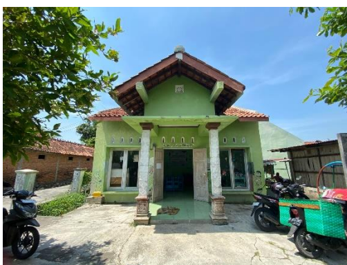
Gambar 3 Tidak ada taman bermain

Selanjutnya faktor biaya pendidikan yang tinggi, membuat PAUD semakin sulit dijangkau oleh masyarakat. Karena faktor biaya pendidikan yang semakin tinggi, tidak banyak dari sebagian orang tua untuk tidak dulu menitipkan anaknya di Kelompok Bermain (KB). Menurut (Uminar 2022) bagi masyarakat di desa, biaya menjadi hal yang paling penting saat memutuskan apakah akan menyekolahkan anak mereka di PAUD Kelompok Bermain (KB) atau tidak. Kebanyakan orang tua lebih memilih untuk menitipkan anaknya ke Taman Kanak-Kanak (TK). Sebagian orang tua belum mengerti bahwa pendidikan anak usia dini di KB Az - Zahra memiliki peranan yang sangat penting dalam menumbuhkan karakter anak. KB Az-Zahra sangat memperhatikan setiap perkembangan moral dan perilaku pada anak.