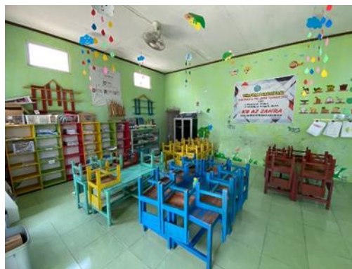
Gambar 2 Ruang kelas

Kendala keuangan menyebabkan terbatasnya anggaran dalam pembangunan sekolah. Faktor tersebut menjadi tantangan guru dalam menyediakan lingkungan belajar yang nyaman. Lingkungan belajar yang nyaman dan mendukung akan membuat siswa lebih mudah berkonsentrasi dan menikmati proses belajar, sehingga hasil belajar yang dicapai pun akan lebih baik (Utamingtyas, Subaryana, and Puspitawati 2021). Lingkungan belajar di KB Az-Zahra masih belum mendukung dalam proses pembelajaran karena ruang kelas yang digunakan kurang luas, sehingga anak-anak sedikit kesusahan dalam mengeksplorasi kegiatan di dalam kelas.