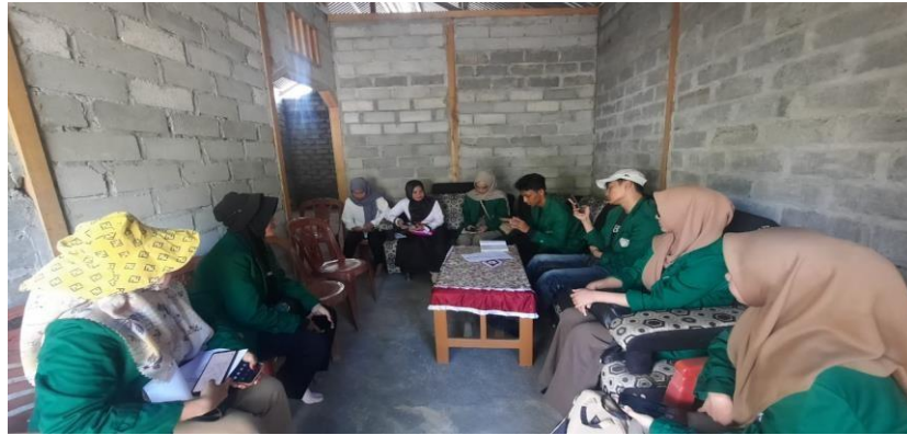
Gambar 1. Observasi Kegiatan

Kegiatan ini dilaksanakan pada hari selasa tanggal 23 Juli 2024 bertempat di Desa Batu Mandi Kecamatan Balantak Utara Kabupaten Banggai. Kegiatan ini dilakukan melalui wawancara langsung dengan pelaku UMKM. Berdasarkan hasil observasi yang dilakukan, dapat disimpulkan bahwa ada beberapa masyarakat pelaku UMKM yang belum sepenuhnya mengetahui tentang adanya penggunaan media sosial untuk usaha tersebut.