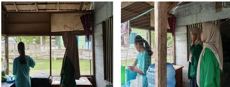
Gambar 2. Koordinasi dengan Pelaku UMKM

Kegiatan ini dilakukan pada tanggal 26 Juli 2024, yaitu melakukan koordinasi kepada pelaku UMKM membahas tentang akan diadakannya Sosialisasi pemasaran digital dan penggunaan media sosial kemudian membahas tentang kapan waktu pelaksanaan kegiatan dan tempat pelaksanaan kegiatan tersebut.