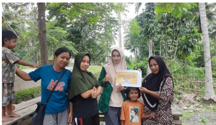
Gambar 4. Proses Sosialisasi

Pelaksanaan kegiatan pada hari Kamis tanggal 01 Agustus 2024 dilakukan sosialisasi pemasaran digital dan penggunaan media sosial bagi UMKM. Bertempat di rumah pelaku UMKM Desa Batu Mandi Kegiatan ini melibatkan masyarakat pelaku UMKM Mereka mendapatkan pemaparan materi langsung, sehingga mereka mendapatkan ilmu dan pengetahuan mengenai pemasaran digital dan penggunaan media sosial.