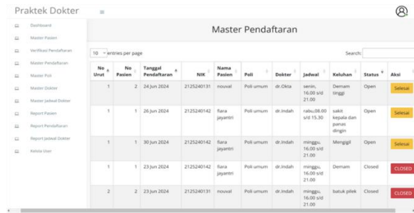
Gambar 3. Fitur Master Pendaftaran