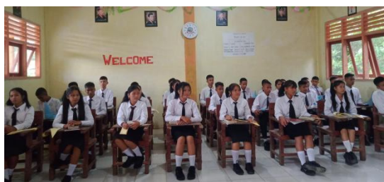
Gambar 1. Siswa Sekolah Menengah Agama Kristen Arastamar Nias Utara