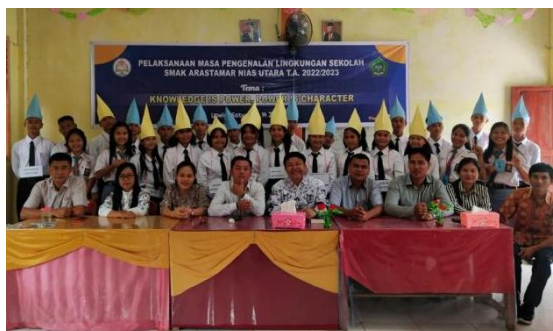
Gambar 2. Guru dan Siswa Sekolah Menengah Agama Kristen Arastamar Nias Utara

Lokasi penelitian dipilih karena sekolah ini mencerminkan keberagaman sosial dan budaya yang khas di Nias Utara. Sebagai sekolah berbasis agama, nilai-nilai keagamaan juga berpengaruh dalam proses pembelajaran. Penelitian ini bertujuan untuk memahami bagaimana keberagaman peserta didik mempengaruhi pembelajaran serta strategi yang digunakan guru untuk menciptakan lingkungan belajar yang inklusif dan efektif.