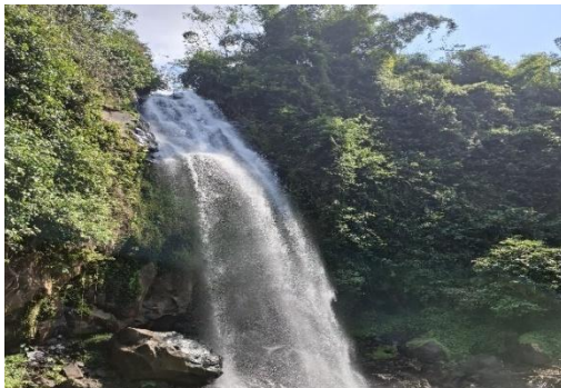
Gambar 1. Wisata Alam Air Terjun Antrukun Trap Sewu

Dengan adanya Peraturan Bupati Lumajang, masyarakat bersama pokdarwis dan pemerintah Desa Bodang, Kecamatan Padang, Kabupaten Lumajang berupaya untuk mengembangkan wisata di Desa Bodang menjadi salah satu objek wisata Kabupaten Lumajang didukung dengan bantuan dan swadaya dari dana Desa Bodang terutama oleh Kepala Desa Bodang yaitu Bapak Kuncoro. Tujuan pengembangan obyek wisata ini salah satunya dilakukan untuk meningkatkan perekonomian masyarakat Desa Bodang. Menghadapi berbagai tantangan dan peluang, peran pemerintah dalam bidang kebudayaan dan pariwisata telah mengalami perubahan signifikan. Destinasi wisata Trap Sewu juga memberikan pengalaman yang memuaskan bagi wisatawan dan manfaat ekonomi bagi penduduk setempat.