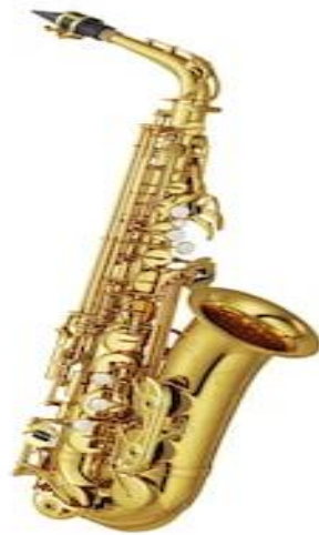
Gambar 2.1 Instrumen musik saxophone