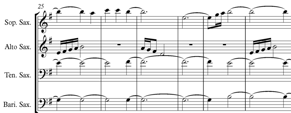
Gambar 12. Aransemen Birama 25-30