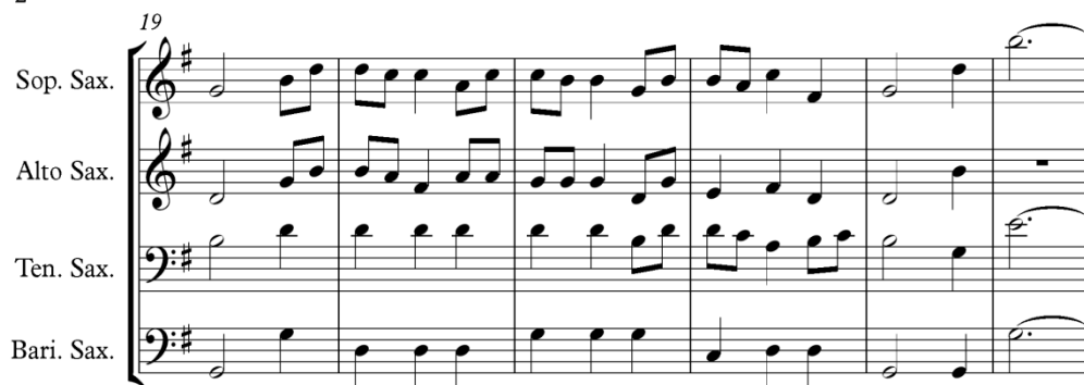
Gambar 11. Aransemen Birama 19-24