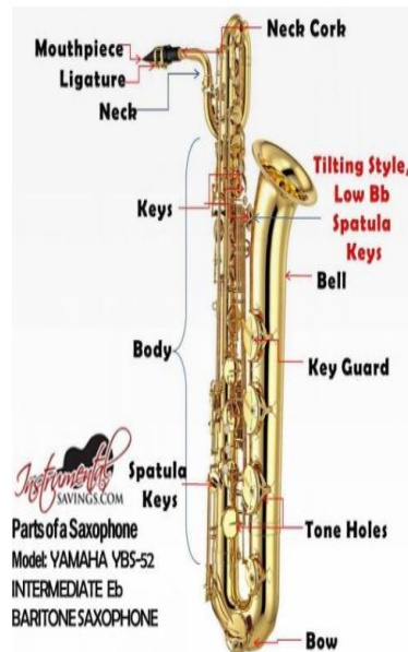
Gambar 5