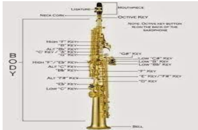
Gambar 3