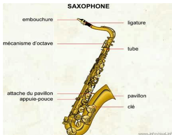
Gambar 4

Tenor sax memiliki nada “Bes=do” disebut in Bes namun ada juga yang bernada C=do, suatu yang unik adalah sebutan tombol saxophon, baik tenor, alto, sopran, pada pads yang sama sebutannya sama meski nadanya tidak sama. Tombol C tenor dan Soprano menghasilkan frekuensi nada Bes pada piano. Tombol C Alto menghasilkan frekuensi nada Es pada piano. Nada nada yang dapat dihasilkan dari Tenor Sax dengan normal mulai ( G nada piano) rendah sampai dengan F oktaf ke 3.