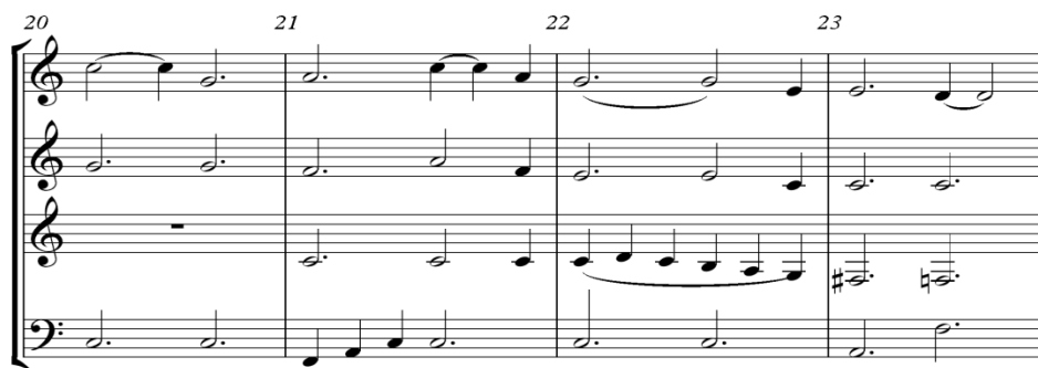
Gambar 7. Notasi 7. Birama 20 sampai 23

Birama 20 sopran, alto dan baritone memainkan nada, sementara tenor diam, tujuannya agar menambah suasana hikmat. Birama 21 baritone melangkah naik dengan memainkan nada F, A, C pada ketukan 1 sampai 3 sementara, alto dan tenor memainkan nada setengah pada ketukan 1 sampai 5. Birama 22 alto dan baritone memainkan not setengah pada ketukan 1 sampai 5, sementara tenor memainkan not seperempat agar kesan menambah indah menuju birama 23 dengan akor I balikan 2.