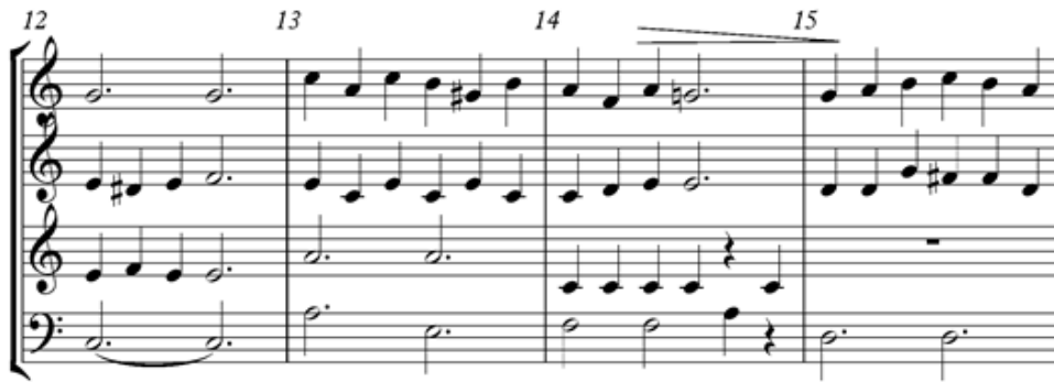
Gambar 5. Notasi 5. Birama 12 sampai 15

Pada birama 12 sampai 13, penulis mengubah nada alto untuk memberi kesan lebih indah dari melodi asli dengan tujuan agar lebih mengikat melodi. Birama 14, tenor tetap memainkan nada C sampai 6 ketuk dan baritone berhenti pada ketukan ke 6 agar suara tenor mempertegas birama 14. Birama 14 ketukan 3 sampai 6 dan ketukan 1 pada birama 15 menggunakan tanda decreasing .