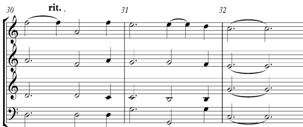
Gambar 10. Notasi 9. Birama 30 sampai 32

Pada birama 28 tenor memainkan nada C,D,C,B,C,dan B memberi hiasan pada akor Caug balikan pertama seolah olah menjadi pembawa melodi, dan birama 29 ketukan 1 sampai 3 memainkan akor tingkat II minor dan pada ketukan 4 memainkan akor tingkat VI Mayor balikan pertama memberi kesan menegaskan, namun pada ketukan 6 berubah menjadi akor vi minor.