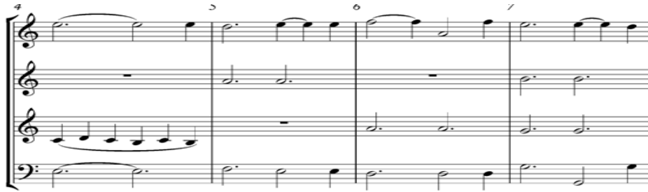
Gambar 3. Notasi 3. Birama 4 sampai 7

Intro lagu ini dimulai dengan penggalan akhir lagu. Birama 1 hingga 8 merupakan intro aransemen lagu, yang dimainkan dengan alto , tenor , dan baritone saxophone. Untuk memberi kesan lembut dan tenang di awal lagu, penulis menggunakan dinamika forte (f) dan mezzo forte (mf) pada birama 1 dan 2, serta pada birama 3 dan 4. Pada birama 8 dibuat tanda trill sebagai kesan untuk menandakan melodi akan dimainkan pada birama 9.