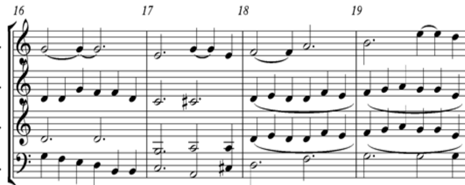
Gambar 6. Notasi 6. Birama 16 sampai 19

Pada birama 12 sampai 13, penulis mengubah nada alto untuk memberi kesan lebih indah dari melodi asli dengan tujuan agar lebih mengikat melodi. Birama 14, tenor tetap memainkan nada C sampai 6 ketuk dan baritone berhenti pada ketukan ke 6 agar suara tenor mempertegas birama 14. Birama 14 ketukan 3 sampai 6 dan ketukan 1 pada birama 15 menggunakan tanda decreasing .