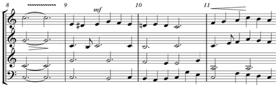
Gambar 4. Notasi 4. Birama 8 sampai 11

Intro lagu ini dimulai dengan penggalan akhir lagu. Birama 1 hingga 8 merupakan intro aransemen lagu, yang dimainkan dengan alto , tenor , dan baritone saxophone. Untuk memberi kesan lembut dan tenang di awal lagu, penulis menggunakan dinamika forte (f) dan mezzo forte (mf) pada birama 1 dan 2, serta pada birama 3 dan 4. Pada birama 8 dibuat tanda trill sebagai kesan untuk menandakan melodi akan dimainkan pada birama 9.