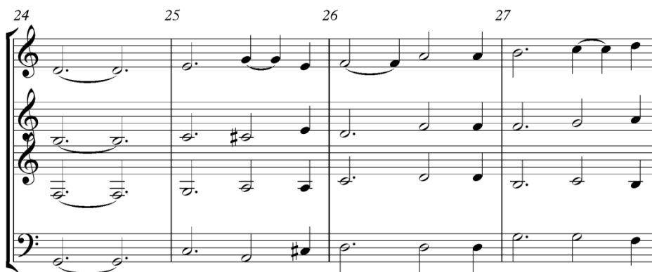
Gambar 8. Notasi 8. Birama 24 sampai 27

Birama 20 sopran, alto dan baritone memainkan nada, sementara tenor diam, tujuannya agar menambah suasana hikmat. Birama 21 baritone melangkah naik dengan memainkan nada F, A, C pada ketukan 1 sampai 3 sementara, alto dan tenor memainkan nada setengah pada ketukan 1 sampai 5. Birama 22 alto dan baritone memainkan not setengah pada ketukan 1 sampai 5, sementara tenor memainkan not seperempat agar kesan menambah indah menuju birama 23 dengan akor I balikan 2.