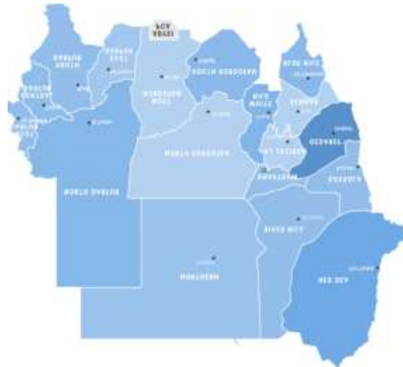
Gambar 1. Peta wilayah Sudan terdampak krisis pangan 2023–2024