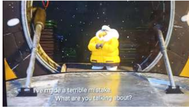
Gambar 10 Mighty Eagle mengungkapkan kejujurannya

Data 1 pada gambar 10 di atas menunjukkan bagaimana karakter Mighty Eagle pada akhirnya mengungkapkan kejujurannya mengenai hubungan ia bersama Zeta sang musuh yang sesungguhnya. Mighty Eagle dengan berani mengungkapkan hal yang selama ini dia pendam dan terasa mengganjal. Hal ini memberikan gambaran bahwa lebih baik berkata jujur daripada memendam sebuah kebohongan, karena kebohongan bisa menyulitkan kita. Seperti yang terlihat dari karakter Mighty Eagle yang tertekan ketika dia memendam sebuah kebohongan tentang ia yang tidak mengenal Zeta.