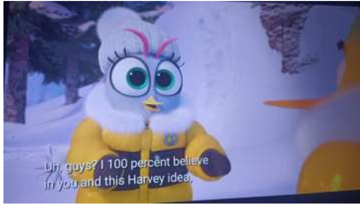
Gambar 7 Silver memberikan nasihat kepada Red

Data 3 gambar 7 di atas menunjukkan bukti lain bahwa film ini mengandung nilai rasa kepercayaan, melalui Tokoh Silver kita belajar pentingnya mempercayai kemampuan setiap individu dalam sebuah tim. Apapun yang dilakukan setiap anggota tim, selama bertujuan untuk mendukung keberhasilan sebuah misi maka hal itu patut untuk dipercayai.