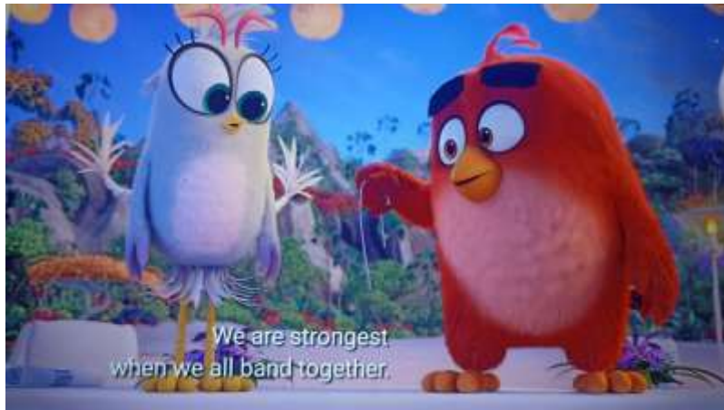
Gambar 2 Pidato Red di akhir film.