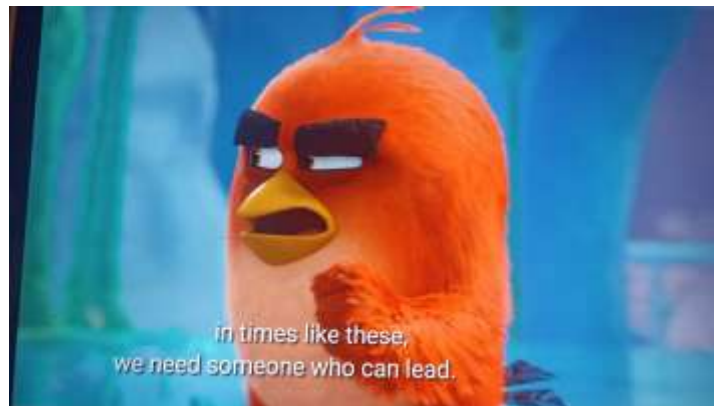
Gambar 11 Red mengalihkan kepemimpinannya kepada Silver