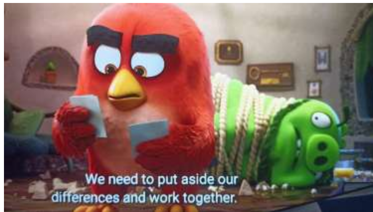
Gambar 9 Negosiasi Leonard untuk menjalin kerja sama