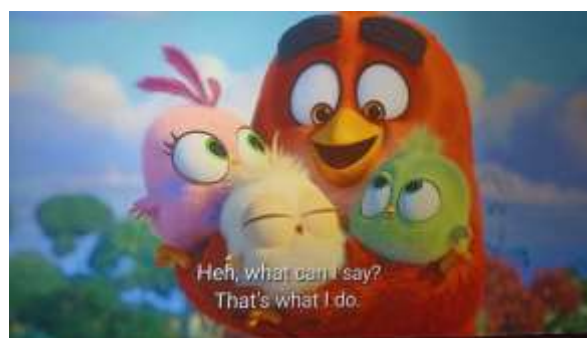
Gambar 5 Red yang merasa bahwa dia bertanggung jawab sebagai pemimpin