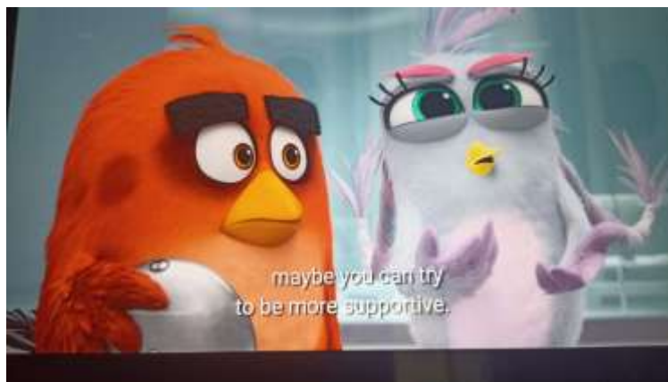
Gambar 6 Silver memberikan nasihat kepada Red

Data 2 gambar 6 di atas menunjukkan bagaimana Silver memberikan pengertian kepada Red agar sedikit memberikan dukungan kepercayaan kepada timnya, dalam hal ini percaya pada teknologi yang dibuat oleh Gerry si ahli laboratorium dari pulau babi yang akan mendukung misi mereka. Red yang awalnya ragu untuk bekerja sama dengan babi, akhirnya belajar bahwa kepercayaan adalah dasar dari setiap hubungan yang baik. Kepercayaan ini membawa mereka untuk merencanakan strategi bersama demi menyelamatkan pulau mereka dari ancaman Zeta.