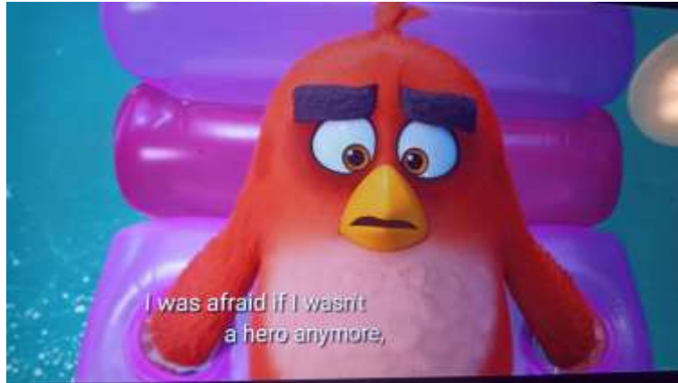
Gambar 3. Red mengungkapkan ketakutannya.