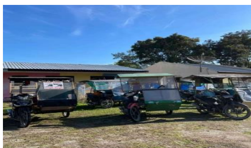
Gambar 5. Becak sebagai transportasi

Kodisi Pariwisata Danau Toba daerah pariwisata Danau Toba tepat di daerah Lumban Silintong memiliki potensi yang sangat bagus untuk dijadikan sebagai destinasi pariwisata. Lumban Silintong memiliki panorama alam yang sangat indah dan lestari, selain itu faktor lain yang mendukung adalah budaya masyarakat yang masih sangat erat dengan budaya Batak yang menjadi nilai tambah daerah ini untuk menjadi destinasi wisata yang sangat bagus. Maka dari itu tempat ini dipilih sebagai tempat terlaksananya event internasional Sport Tourism F1H2O.