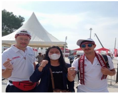
Gambar 3. Penelitian lapangan