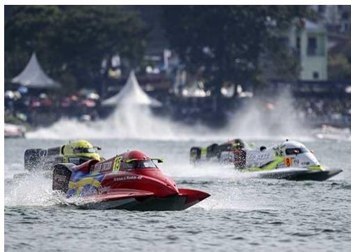
Gambar 1. Penampakan F1 Power Boat Balige

Ada enam negara beserta tim asal atau markas tim yang berlaga di Danau Toba nantinya: Uni Emirat Arab/UEA: Abu Dhabi Team, Victory, dan Sharjah Team, Prancis: China C Tic Team dan Maverick Racing, Italia: Comparato F1 dan Gillman Racing, Portugal: F1 Atlantic Team, Swedia: Team Sweden, Norwegia: Stromoy Racing F1H2O Team. Maka dari itu, kita sebagai masyarakat Indonesia terkhususnya masyarakat kawasan Destinasi Pariwisata Super Prioritas (DPSP) Danau Toba bangga karena bisa menjadi tuan rumah untuk event Internasional ini. Namun, tidak hanya dampak positif saja yang terjadi ada juga dampak negatif yang ditimbulkan oleh event Internasional ini.