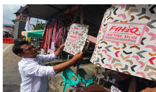
Gambar 6. Masyarakat menjadi pedagang