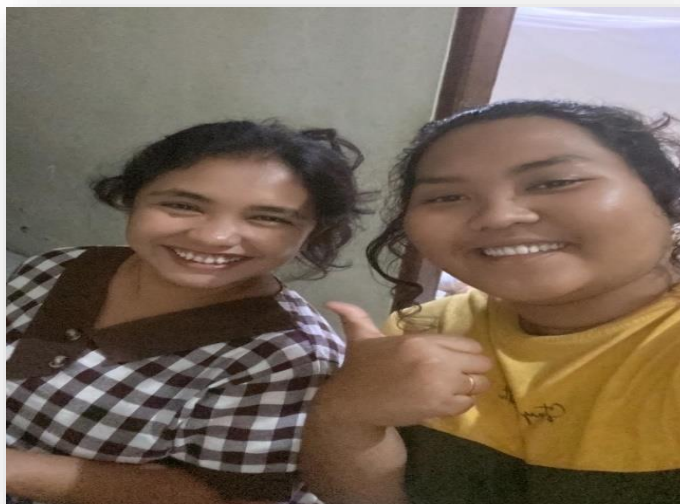
Gambar 3.3 Pendekatan Keempat

curhat, bahkan siswi di sekolah mau curhat mengenai kisah menyukai lawan jenis disekolah, beliau maklum bahwa di masa sekarang adalah masa emasnya mereka pubertas. Saya berharap bisa menjadi teman dekat beliau.