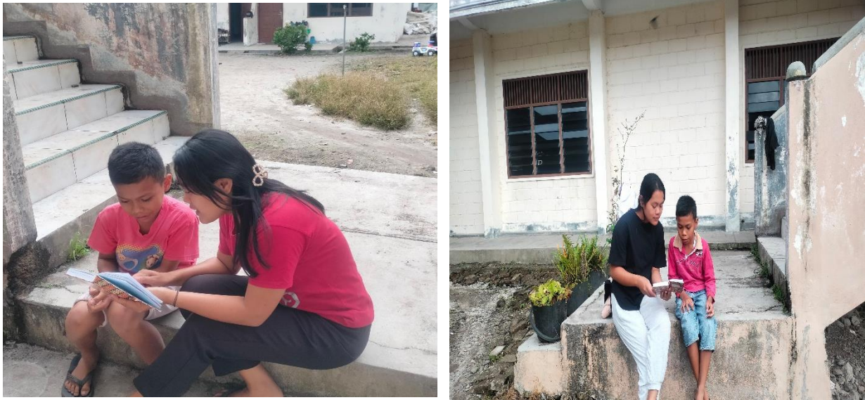
Gambar 1.6 . Perkembangan Bahasa