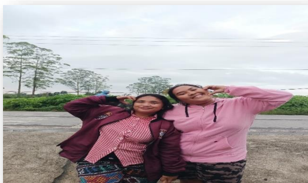
Gambar 3.4 Pendekatan Kelima

Pendekatan yang saya lakukan adalah tahap menyatupadukan. Dalam tahap ini interaksi yang kami lakukan semakin dekat dan tidak ada lagi kecanggungan satu sama lain. Kami berdua melakukan olahraga yaitu bermain raket dan berjalan hampir setiap hari kedepan ke merek untuk membuang rasa kebosanan di dalam mess, sehingga postur badan semakin berkurang sedikit.