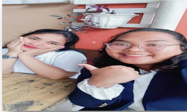
Gambar 3.1 Pertemuan Kedua