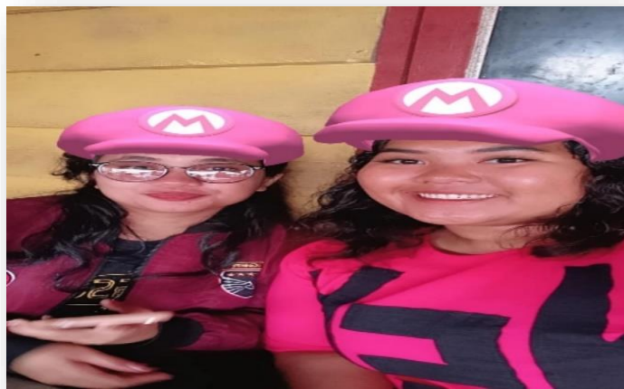
Gambar 3.2 Pertemuan Ketiga

Tahap pendekatan yang saya lakukan adalah tahap penjajakan. Dalam tahap ini mendatangi mess beliau, saya mengamati keadaan jasmani dan rohani beliau Puji Tuhan baik. Setelah saya mengamati lalu bercerita mengenai Profile sekolah Yapim Merek, dikarenakan beliau adalah tenaga kerja sebagai seorang Guru Kejuruan serta membagikan pengalaman kerjanya di sekolah tersebut. Dan setelah kami bercerita panjang lebar, beliau mengajak saya makan mieso.