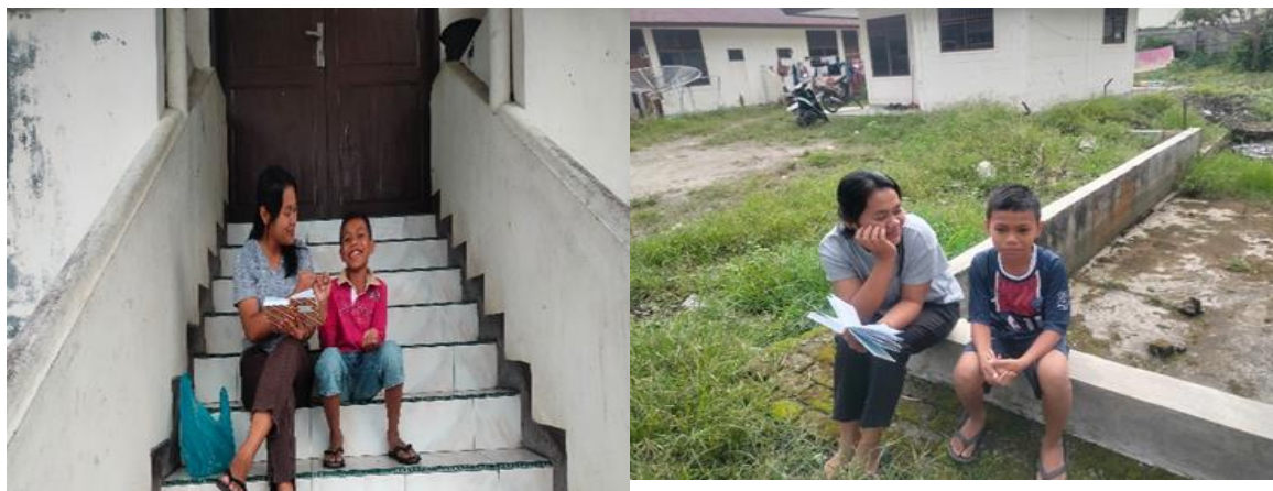
Gambar 1.4 Perkembangan Kepribadian dan Emosi

Dia hanya menjawab "menangis dan merasa kesal kepada seseorang yang sudah membuat dia marah" dan Dia mudah memaafkan teman nya dan melupakan kesalahan mereka.