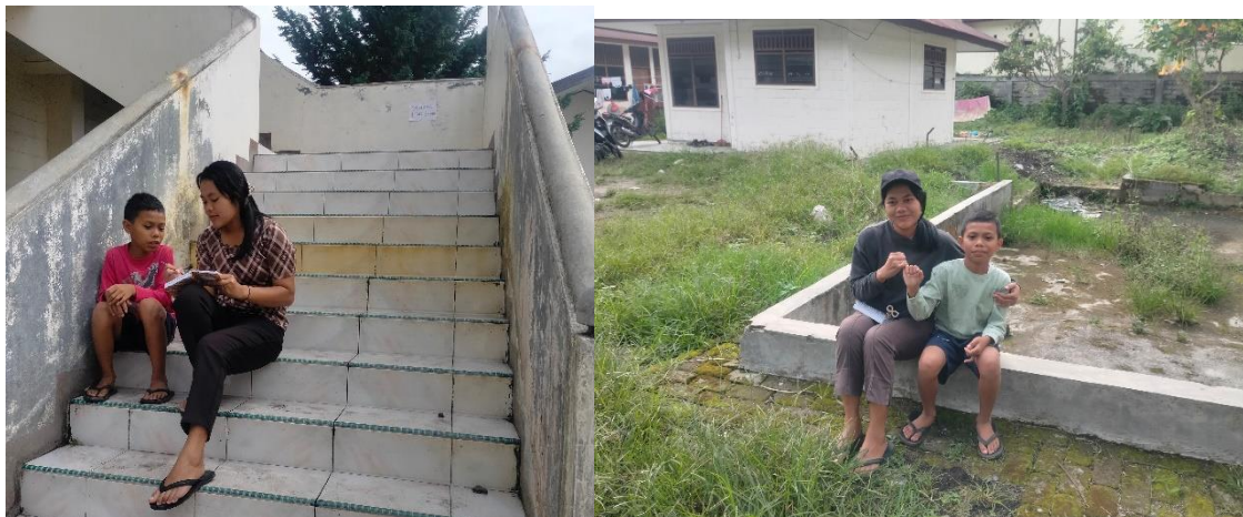
Gambar 1.7. Perkembangan Kesadaran Beragam

Pendekatan Psikologi: Refleksi membantu anak menginternalisasi pengalaman mereka dan mengembangkan kemampuan metakognitif (kesadaran diri).