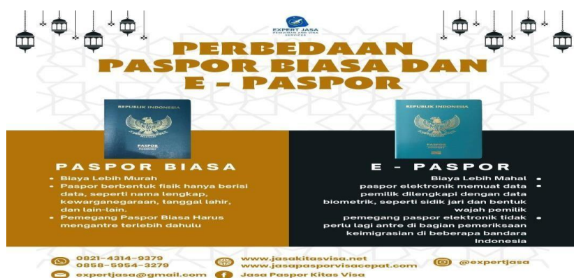
Gambar 1. Perbedaan Paspor Biasa dan E-Paspor

Kantor Imigrasi Kelas I TPI Pekanbaru telah menetapkan Zona Integritas sebagai upaya untuk mewujudkan Wilayah Bebas dari Korupsi (WBK) dan Wilayah Birokrasi Bersih dan Melayani (WBBM) di lingkungan kerjanya. Melalui zona integritas, Kantor Imigrasi berkomitmen untuk melaksanakan administrasi yang terbuka dan transparan, serta menjalankan tugas-tugas sesuai aturan hukum yang berlaku.