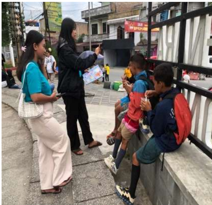
Gambar 5. Interaksi antara relawan dan anak-anak di taman.