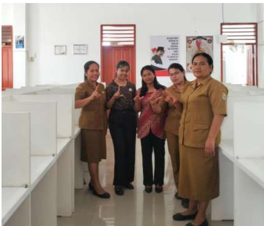
Gambar 6. Foto bersama tim pelaksana dan staf perpustakaan sebagai penutup kegiatan

Saat kami mencoba mencari tahu penyebab ketidakhadiran mereka, sebagian besar anak-anak mengaku merasa bosan dengan kegiatan belajar dan lebih memilih untuk bermain atau beristirahat di rumah. Kondisi ini mencerminkan rendahnya motivasi belajar yang masih menjadi tantangan besar di masyarakat setempat. Padahal, pengembangan literasi tidak hanya terbatas pada kemampuan membaca dan menulis, tetapi juga mencakup kemampuan berpikir kritis, komunikasi yang baik, serta penerapan ilmu dalam kehidupan sehari-hari. Kemampuan-kemampuan ini penting untuk membentuk individu yang aktif, percaya diri, dan mampu berkontribusi dalam masyarakat.