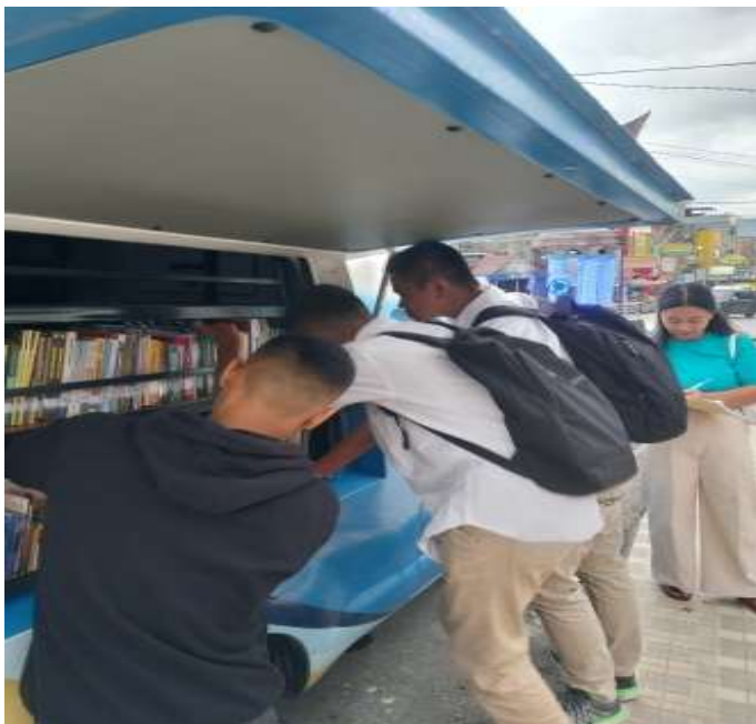
Gambar 2. Anak-anak memilih buku secara bebas ditaman.