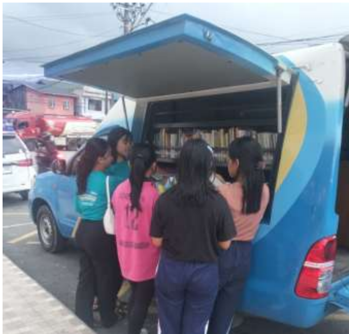
Gambar 4. Anak-anak menceritakan kembali isi buku yang mereka baca.

berbagai kegiatan literasi yang dilaksanakan di Taman Lonceng, Tarutung, Kelurahan Hutatoruan X, Tapanuli Utara. Kegiatan ini dirancang untuk memberikan pengalaman belajar yang menyenangkan di luar ruang kelas formal. Namun, meskipun waktu dan tempat telah disediakan secara terbuka dan nyaman, hanya sebagian kecil anak-anak yang hadir secara rutin. Sebagian lainnya hanya datang satu hingga dua kali, lalu tidak kembali lagi.