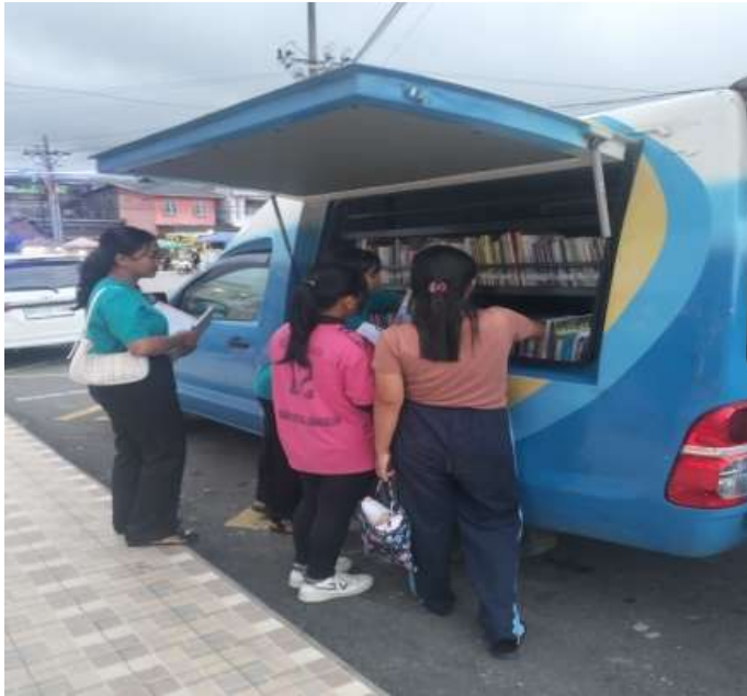
Gambar 1. Mobil perpustakaan keliling tiba di lokasi kegiatan.