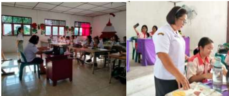
Gambar 1. Kegiatan Pengumpulan Data