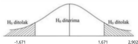
Gambar 4 Hasil Uji T Disiplin Kerja

4. Menentukan daerah penolakan atau penerimaan