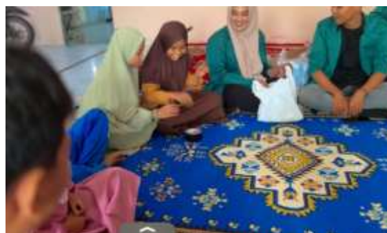
Gambar 3. Permainan Pertama Lempar Bola Pertanyaan Kepada Peserta Panti Asuhan Bhakti

Games pertama yang dilaksanakan yaitu permainan lempar bola pertanyaan. Pada permainan ini seluruh peserta duduk membentuk lingkaran setelah itu media yang digunakan untuk lempar pertanyaan dilempar secara bergantian kepada peserta dengan suasana yang penuh semangat namun tetap kondusif. Setelah fasilitator menghentikan putaran media pertanyaan, peserta terakhir yang memegang media akan diberikan pertanyaan yang berkaitan dengan materi yang telah disampaikan dan peserta harus menjawab sesuai pemahaman informasi-informasi yang telah didapatkan. Dalam pelaksanaannya pertanyaan yang digunakan meliputi materi-materi yang sudah disampaikan saat sesi penyampaian materi tujuannya untuk menguji dan mengukur sejauh mana pemahaman materi serta melatih keberanian mereka dalam menyampaikan jawaban-jawaban di depan teman-temannya.