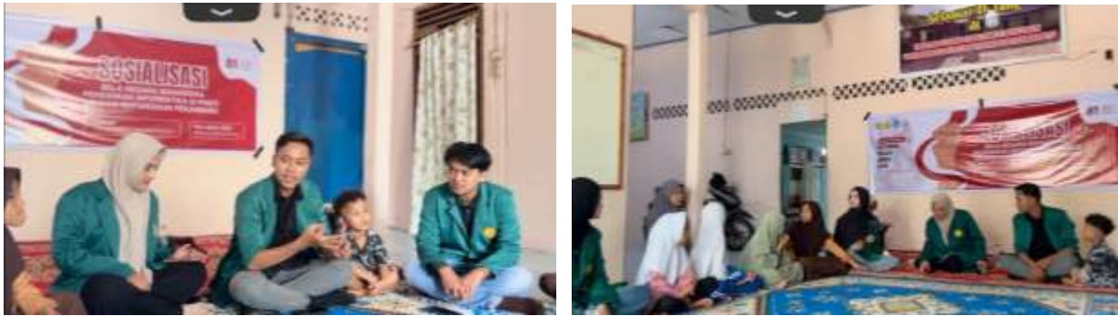
Gambar 2. Penyampaian Materi Bela Negara Kepada Peserta Panti Asuhan Bhakti Mufarridhun Pekanbaru.

temannya ketika mereka diberikan kesempatan untuk menjawab sebuah pertanyaan maupun menyampaikan suatu pendapat (Agusdianita et al. 2025).