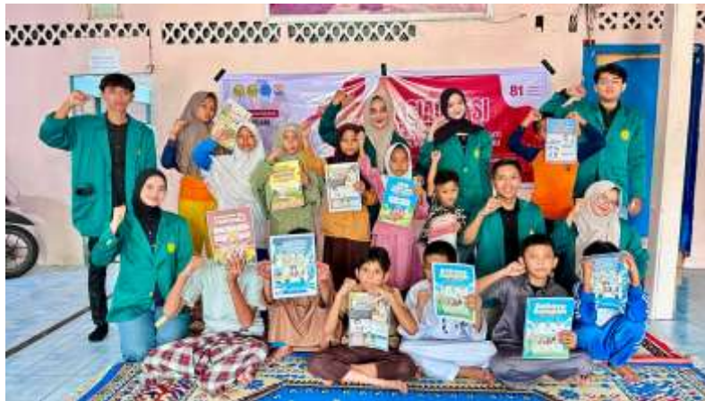
Gambar 7. Dokumentasi Pengabdian Kepada Peserta Panti Asuhan Bhakti Mufarridhun Pekanbaru.

Nilai-nilai yang telah didapatkan peserta menjadi bagian penting untuk pembentukan karakter generasi muda yang mampu menjadi penerus bangsa berkualitas. Dengan begitu, kegiatan pengabdian masyarakat memberikan manfaat pembentukan karakter yang dapat dimanfaatkan dalam jangka panjang (Setiyawati and Simanuhuruk 2026).