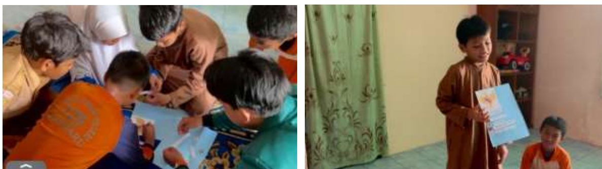
Gambar 4. Permainan Kedua Cocokkan Kartu Pancasila Kepada Peserta Panti Asuhan Bhakti

Kegiatan tersebut memberikan peserta pelajaran bahwa keberhasilan kelompok tidak hanya ditentukan oleh kemampuan individu, tetapi yang sangat penting adalah bekerjasama dengan anggota kelompok. Nilai bekerjasama inilah yang dapat menimbulkan jiwa persatuan dan menjadi bagian penting dari materi bela negara yang dapat dipraktikkan secara langsung dalam games ini.