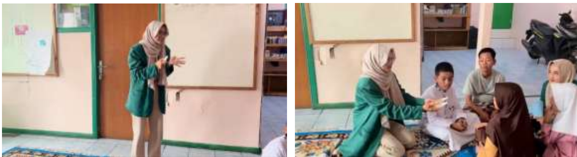
Gambar 5. Edukasi Kesehatan dan Penjelasan Spray Anti Nyamuk Kepada Peserta Panti Asuhan

Pada kegiatan sesi ini peserta diberikan edukasi pemahaman bahwa menjaga kesehatan merupakan bentuk tanggung jawab terhadap diri sendiri dan lingkungan sekitar. Individu yang selalu menjaga kesehatan memiliki kemampuan yang lebih baik untuk beraktifitas seperti belajar, bekerja, dan kontribusi kepada masyarakat. Oleh sebab itu, menjaga kesehatan dapat dipandang menjadi salah satu bentuk implementasi bela negara nonfisik yang bisa dilakukan oleh setiap warga negara. Materi yang disampaikan oleh fasilitator yaitu bahaya penyakit ditularkan melalui nyamuk, pentingnya menjaga kebersihan lingkungan, serta berbagai cara untuk mencegah yang dapat dilakukan dalam kehidupan sehari-hari. Peserta diajak berdiskusi mengenai keharusan kebiasaan menjaga kebersihan lingkungan dan menghadapi gangguan nyamuk terutama penyebab DBD (Utami and Cahyani 2020).