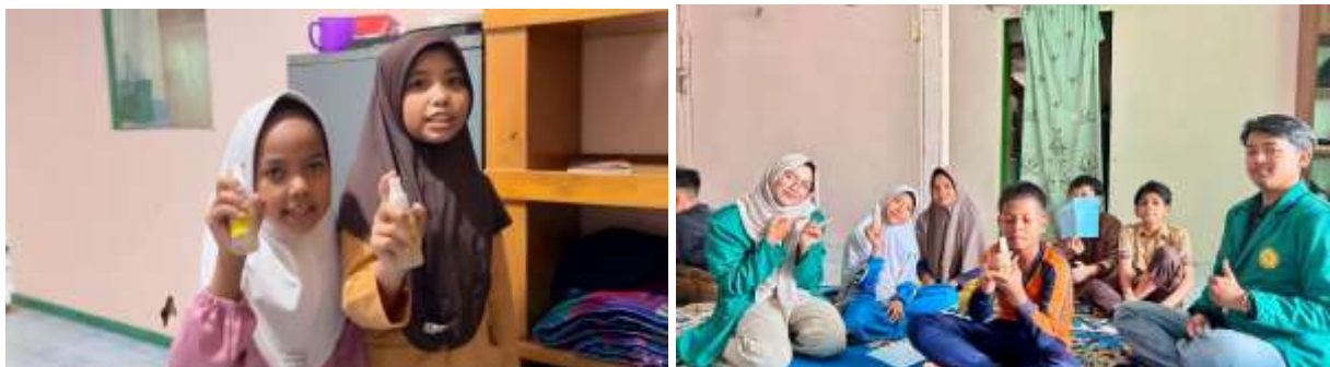
Gambar 6. Pembagian Spray Anti Nyamuk Kepada Peserta Panti Asuhan Bhakti Mufarridhun Pekanbaru.

Sebagian bentuk implementasi nyata dari edukasi kesehatan yang telah diberikan, tim pengabdian masyarakat telah membuat spray anti nyamuk dan langsung memperkenalkan spray anti nyamuk alami berbahan serai (Kristanti et al. 2024). Produk ini dibuat menggunakan bahan alami yang mudah diperoleh dan relatif aman digunakan dalam kehidupan sehari-hari. Fasilitator memberikan penjelasan langsung mengenai kandungan serai terdapat kandungan alami pengusir nyamuk. Aroma khas yang dihasilkan oleh minyak atsiri serai diketahui tidak disukai nyamuk dengan begitu kandungan inilah yang membantu mengurangi gangguan nyamuk dilingkungan sekitar (Huda, Fathoni, and Larasati 2022).